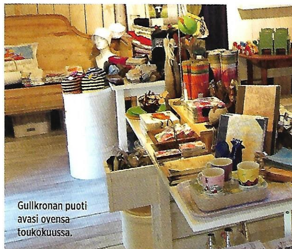
Gullkronan puoti avasi ovensa toukokuussa.

Sopivia yöpymispaikkoja Sattmarkin läheisyydessä ovat Paraisten kaupungin mainio satama Kalkholmen (satama 644, kts. VENE 8/2012) ja Paraisten portti (satama 638, VENE 8/2013). Paraisten portille nousi muutama vuosi sitten uusi uljas ravintola, jonne veneen kannelta on vain reipas loikkaus. U