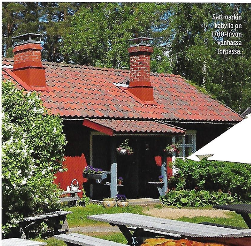
Sattmarkin kahvila on 1700-luvun vanhassa torpassa.

nasta löytyvä Sattmarkin kahvitupa on saanut uuden yrittäjän mukana myös uuden nimen.